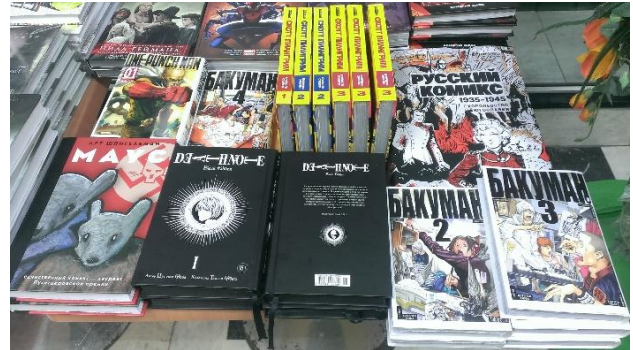
モスクワの書店に並ぶ日本の漫画

ロシア語はロシア、ベラルーシ、カザフスタン、キルギスで公用語の地位を占める言語です。またウクライナやウズベキスタンをはじめとする旧ソ連諸国では、現在でも数百万～数千万単位でロシア語話者が存在します。話者数はおよそ2億3000万人にもものぼるとされ、国連の公用語にも指定されています。ギリシア文字から作られたキリル文字を使用し、言語系統的にはウクライナ語やチェコ語、ポーランド語、ブルガリア語等と同じスラヴ語派に属します。見慣れない表記に最初は戸惑うでしょうが、例年ゴールデン・ウィークが明ける頃には、受講者はロシア語の読み書きにはすっかり慣れます。文法は典型的な屈折語タイプで、名詞類が6つも格変化（日本語のテニヲハに近いもの）し、覚えることはたくさんありますが、そのぶん文法事項はしっかり整理されているので勉強しやすく、発音も比較的平易です。